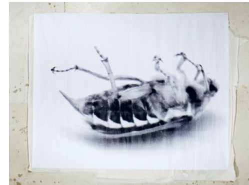
live is life | 2016