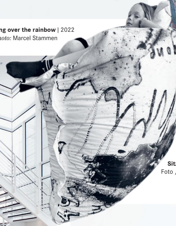
Sitzsäcke | 2022