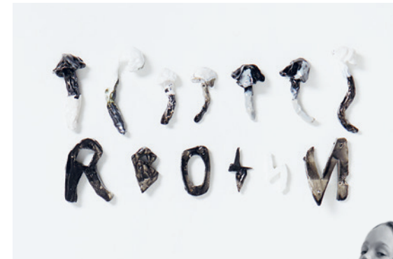
something over the rainbow | 2022