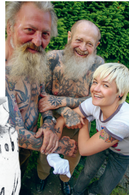
Auf der Suche nach Sigg | 2008