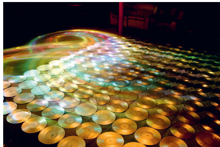
The Evil and the x on Burnerchrome | 2009