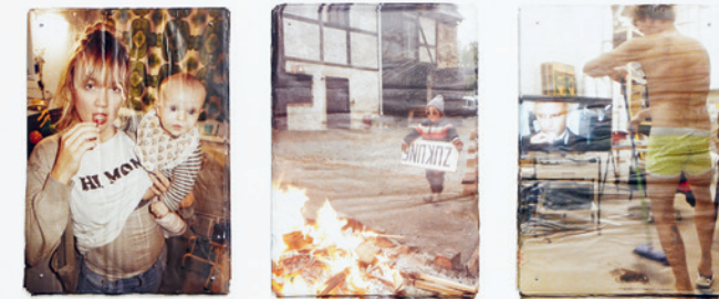
Familienaufstellung | 2022 | Foto / Photo: Marcel Stammen

With an overwhelming all-over of tattoos, works on paper, videos, sculptures and even fashion, Hamburg artist Franziska Nast (*1981) transforms the Arp Museum into a dynamic cosmos.